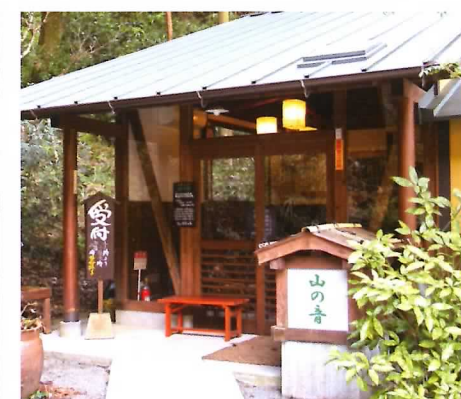
▲天然温泉旅館快生館の家族湯