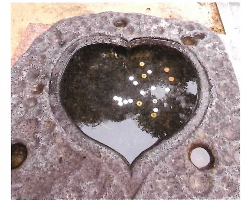
▲古賀神社のハート形手水鉢