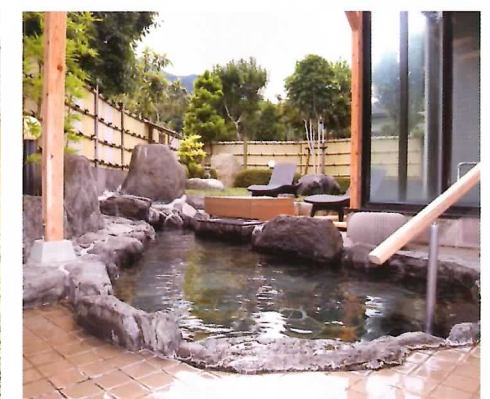
▲日帰りの湯 偕楽荘