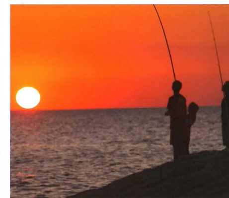
▲古賀海岸から見る夕陽