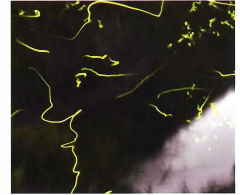
▲薬王寺のホタル乱舞